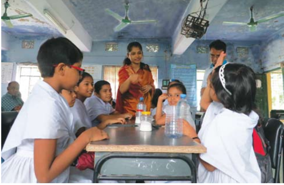
পিটিআই লক্ষ্মীপুর সংলগ্ন পরীক্ষণ বিদ্যালয়ের শিক্ষার্থীরা শিখন শেখানো প্রক্রিয়ায় তাদেরকে সম্পৃক্ত করেছে, TSN কার্যক্রম ২০১২-১৩