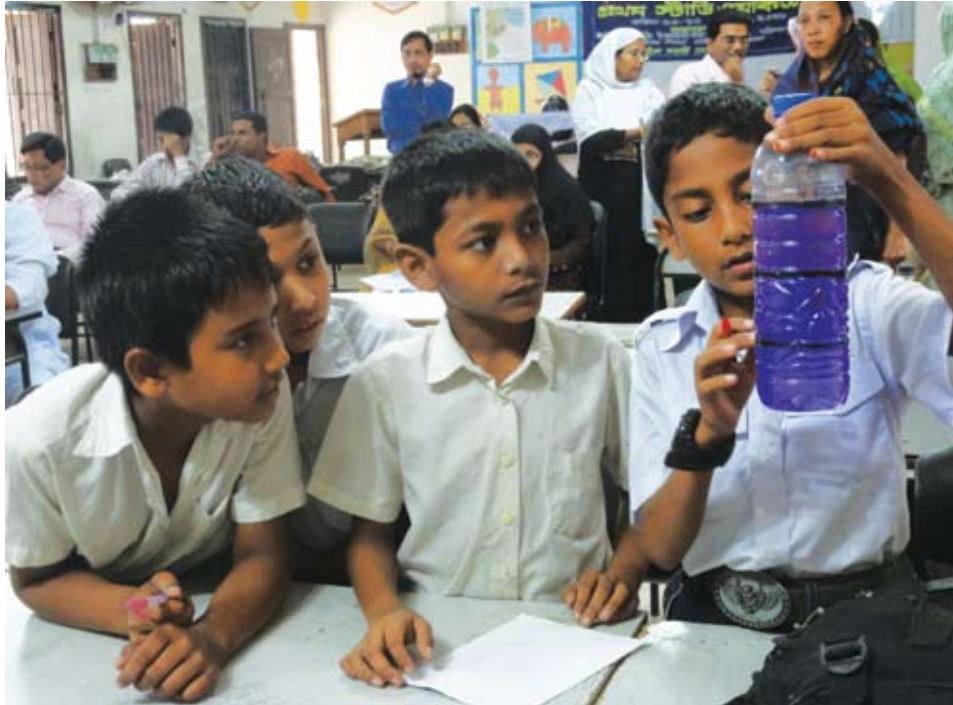
পাঠ সমীক্ষা প্রক্রিয়ায় (Lesson Study Process) শিখন শেখানোর কার্যক্রমে একদল শিক্ষার্থী দলীয় কাজে অংশগ্রহণ করছে