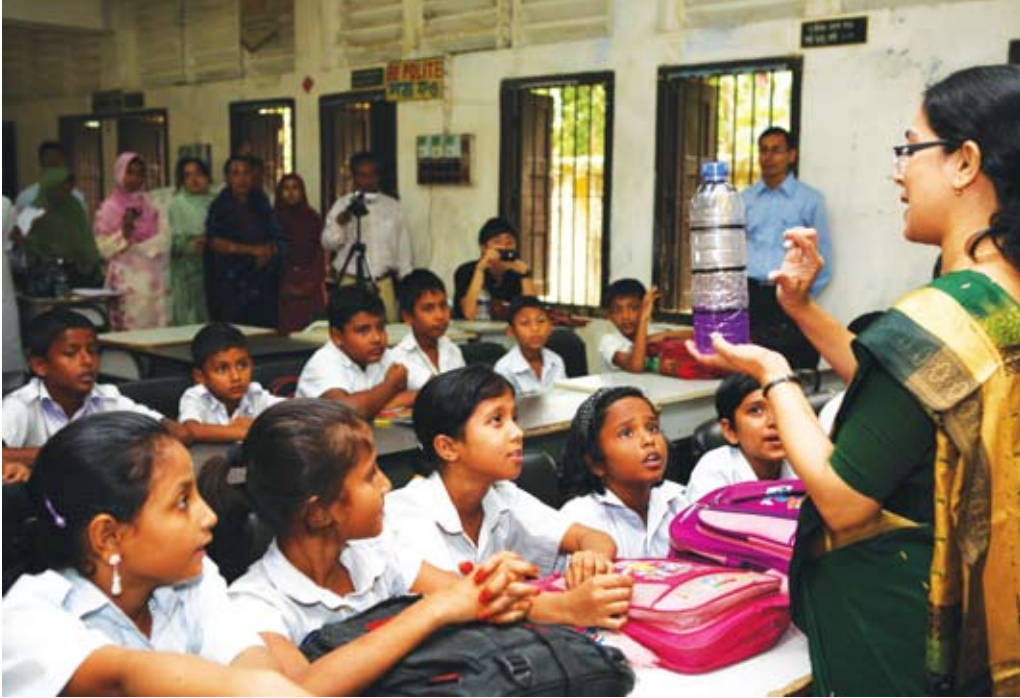
একজন শিক্ষক কর্তৃক পরিচালিত শিখন শেখানো কার্যক্রম (বাস্তবায়ন পর্যায়), যেটি সহকর্মী ও সংশ্লিষ্ট কর্মকর্তাগণ পর্যবেক্ষণ করছেন, সাগরদী পিটিআই বরিশাল