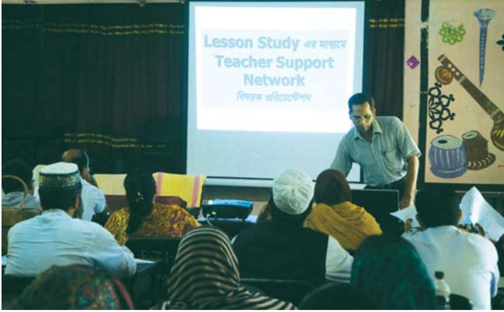
গত অর্থ বছরে (২০১২-১৩) টাঙ্গাইল পিটিআইতে অনুষ্ঠিত TSN ওরিয়েন্টেশন কার্যক্রমের একটি অধিবেশন